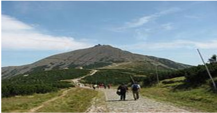
Śnieżka najwyższy szczyt Sudetów