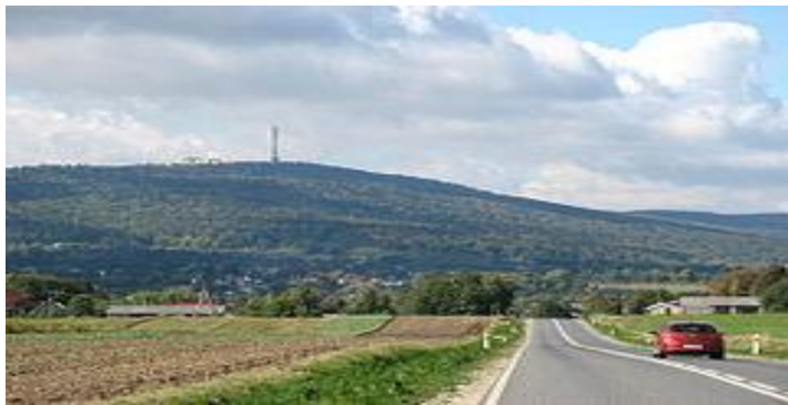
Widok na Łysą Górę