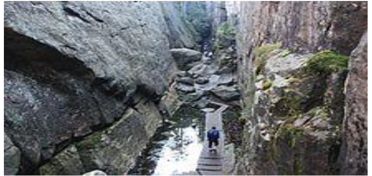
Piekło na Szczelińcu Wielkim- Góry Stołowe