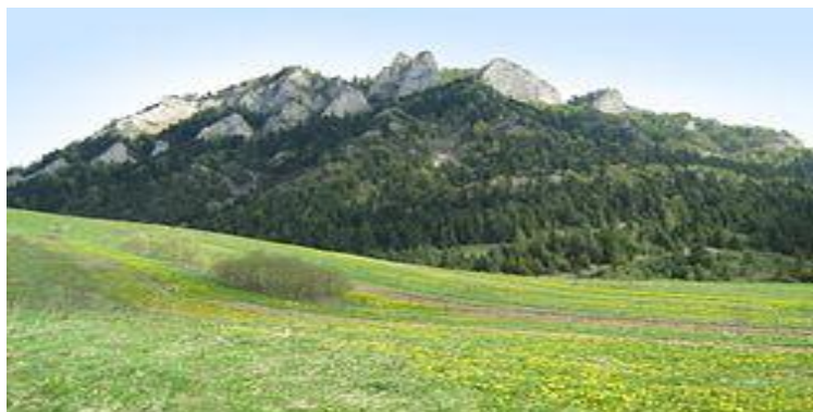
Trzy Korony (Pieniny)