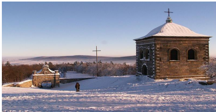
Widok ze Świętego Krzyża