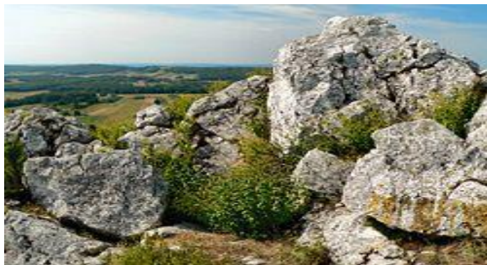
Wapienne skały na szczycie Miedzianki